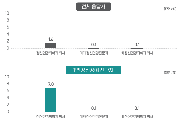
1년 동안 정신건강 상담 경험 비율